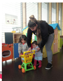
A la Marelle

Le soutien à la parentalité est un des premiers champs d'action de l'association. Les enfants de 3 à 6 ans étant très peu scolarisés en maternelle du fait de son caractère non obligatoire, et constatant que cela pouvait mener à une situation de fragilité à leur entrée au CP, il semblait important que les parents puissent avoir l'opportunité de sociabiliser le tout petit en le confrontant à d'autres enfants non issus de la communauté et où il puisse baigner dans la langue française naturellement. Chaque semaine les parents qui le souhaitent sont accompagnés avec leur tout petit à la MARELLE à Bischwiller, le LAEP, lieu d'accueil enfant parent de secteur, qui propose un accueil anonyme et gratuit dans un bel espace flambant neuf, très lumineux, disposant aussi d'un grand extérieur où les enfants peuvent faire du vélo ou de la trottinette.