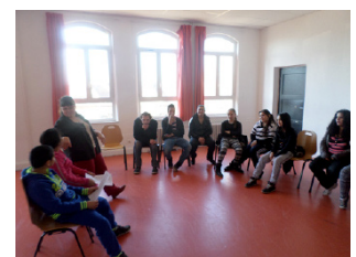
Atelier de théâtre